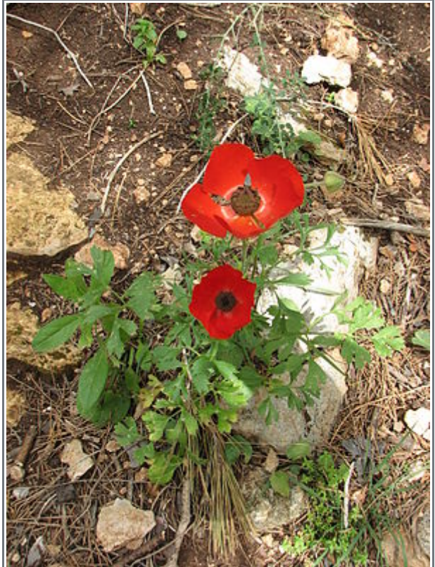
Ranunculus asiaticus Wildform am Naturstandort