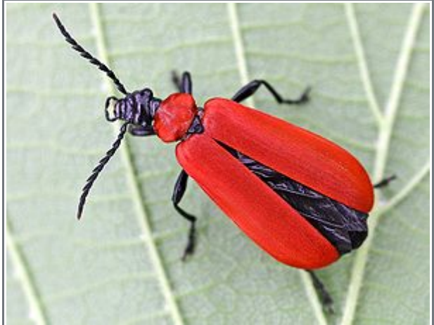
Scharlachroter Feuerkäfer ( Pyrochroa coccinea )