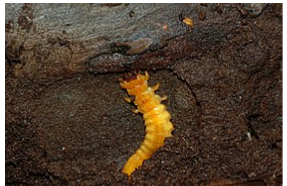
Larve des Scharlachroten Feuerkäfers ( Pyrochroa coccinea )