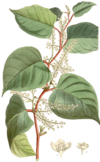
Illustration aus Curtis's Botanical Magazine , Tafel 6503

Der Japanische Staudenknöterich ist eine sehr schnellwüchsige (wuchernde), sommergrüne, ausdauernde krautige Pflanze . Als Überdauerungsorgane bildet er Rhizome , durch die oft dichte, ausgedehnte Bestände entstehen. Im Frühling treibt er aus seinen Rhizomen („Wurzelstöcken“, Erdkriechsprossen), oft nesterweise an „Rhizomköpfen“, neue Stängel („Rameten“), die unter günstigen Bedingungen innerhalb weniger Wochen eine Wuchshöhe von 3 bis 4 Metern erreichen, wobei die Pflanze einen Zuwachs von 10 bis 30 Zentimeter pro Tag erreichen kann. Die