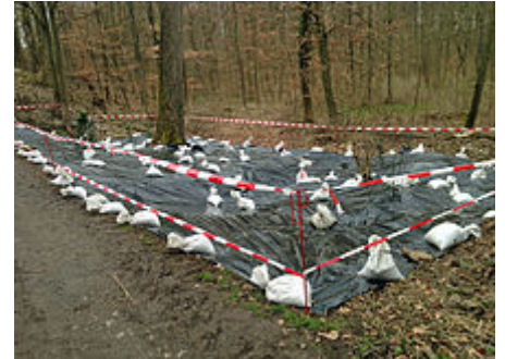
Versuch der Bekämpfung durch Abdeckung mit „schwarzer Folie“

Als Alternative zur Chemie wurden weitere Verfahren erprobt, wie z. B. im Regierungspräsidium Freiburg [16] das Dämpfen , bei dem in den befallenen Flächen die problematischen unterirdischen Knöterichteile mit heißem Dampf z. T. abgetötet wurden. Nachteilig ist bei diesem Verfahren, dass Bodenlebewesen ebenfalls abgetötet werden. Im Stadtwald von Bad Vilbel in der Nähe von Frankfurt am Main wird seit März 2013 versucht, die Ausbreitung durch großflächige Abdeckung mit schwarzer Kunststoff-Folie zu verhindern, die den austreibenden Stängeln das Licht nimmt. Hierdurch treten weniger unbeabsichtigte Schäden auf. Eine Alternative zur chemischen Bekämpfung stellt die im April 2010 vom britischen Forschungsinstitut Cabi begonnene Aussetzung [17][18] der japanischen kleinen Blattflohart Aphalara itadori dar. Diese Psyllidenart hat in Laboruntersuchungen keinerlei Appetit auf andere mitteleuropäische Pflanzen gezeigt und soll in Großbritannien und den Niederlanden [19] versuchsweise im Freiland ausgesetzt werden. Berichte über Erfolge stehen aus.