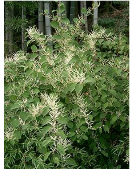
Habitus einer gerade erblühenden männlichen Pflanze