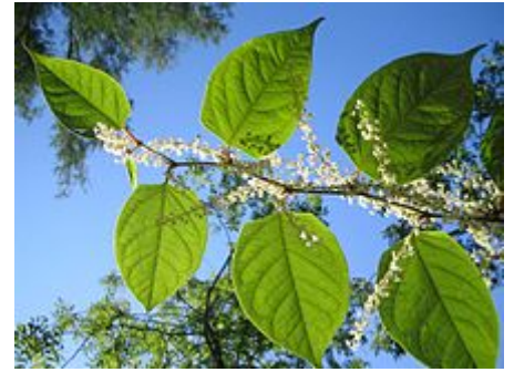
Fallopia japonica mit wechselständigen Laubblättern: Der Stängel bildet eine Zickzack-Linie und in den oberen, lichtenahen Blattachseln Blütenstände

Die wechselständig am Stängel angeordneten Laubblätter sind in Blattstiel sowie Blattspreite gegliedert und 5 bis 20 Zentimeter lang. Die einfache mit einer Länge von bis zu 12, selten bis 18 Zentimetern und einer Breite von bis zu 8, selten bis 13 Zentimetern breit-eiförmige, beinahe ledrige Blattspreite besitzt einen rechtwinklig gestutzten Spreitengrund sowie eine schmale Spitze („Träufelspitze“). Die kurzen Haare auf den Blattadern der Blattunterseite sind ohne Lupe kaum zu sehen.