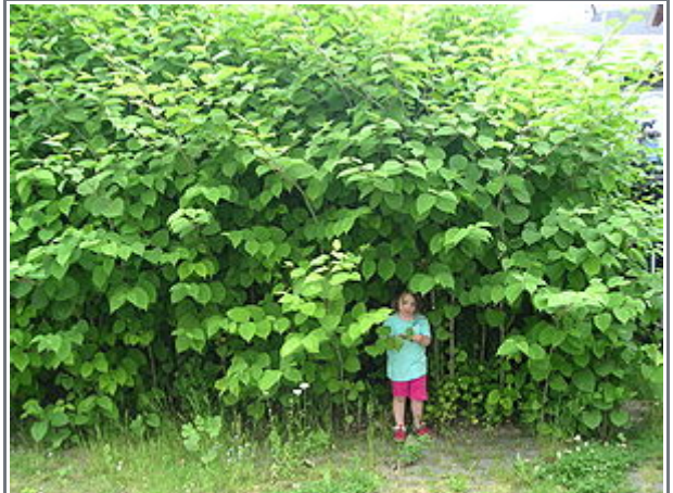
Japanischer Staudenknöterich ( Fallopia japonica ), typischer Bestand