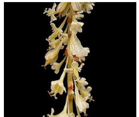
Blüten einer weiblichen Pflanze