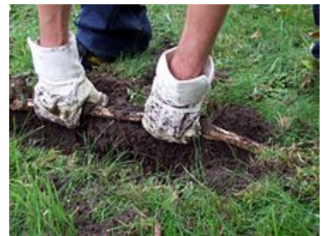
bereits viele Jahre altes, verholztes Rhizom von Fallopia japonica

Etwas seltener findet man den von der Insel Sachalin stammenden, ihm ähnlichen Sachalin-Staudenknöterich ( Fallopia sachalinensis ), der in ähnlicher Weise kultiviert wird und auch verwildert. Dieser unterscheidet sich vom Japanischen Staudenknöterich durch höheren Wuchs (bis 4,3 Meter), größere, bis zu 30 Zentimeter lange Laubblätter mit deutlich herzförmigem Spreitengrund und grünlichweiße Blütenstände.