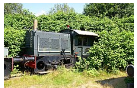
Diese alte Lokomotive in Beekbergen (Niederlande) ist überwuchert von Knöterich. Vor einigen Jahren war dieser Ort noch Knöterich-frei, siehe Google Maps ( http://maps.google.de/maps?hl=de&ie=UTF8&ll=52.160037,5.987602&spn=0.000918,0.002991&t=h&z=19/ ).