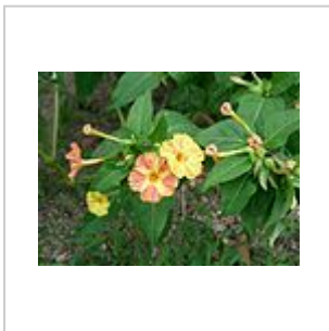
Blüten und Blätter